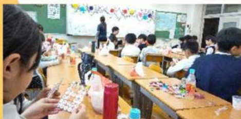
クリスマス会(ビンゴ大会)