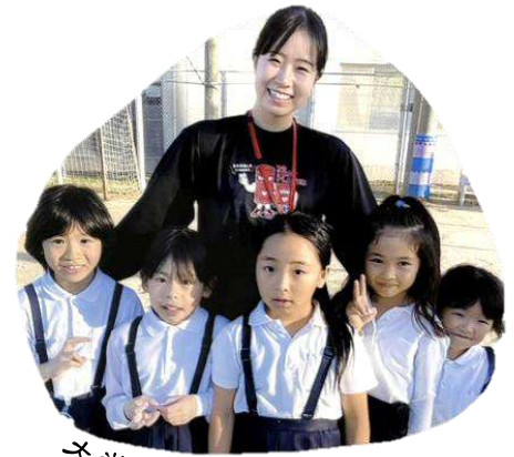
大生との仲間づくり