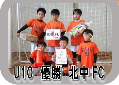
U10 優勝 北中 FC