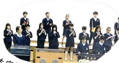
大空にひびけコンサート (長坂小)