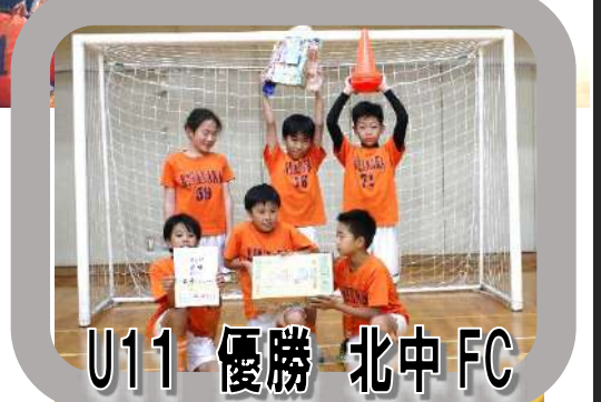
U11 優勝 北中 FC