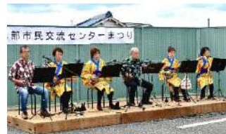
▶沖縄三線クラブ「ムミンパナ・イチユパナ・ムリクパナ」