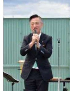
▶衆議院議員 いとう信久議員