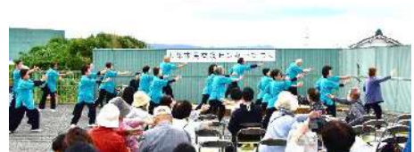
▶太極拳クラブ「水桜」