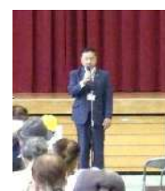
泉佐野市 千代松市長