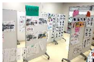
▶第三中学校 長坂小学校 北中小学校 日新小学校