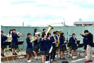
▶第三中学校吹奏楽部