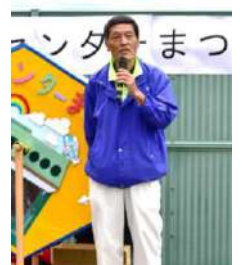
▶青少年分館 用松館長