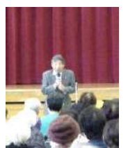
社会福祉協議会 西願会長