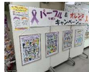
▶泉佐野市人権推進課