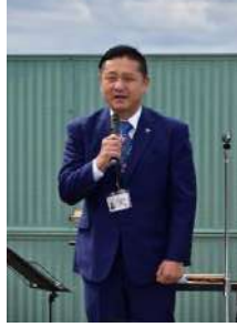
▶泉佐野市 千代松大耕市長