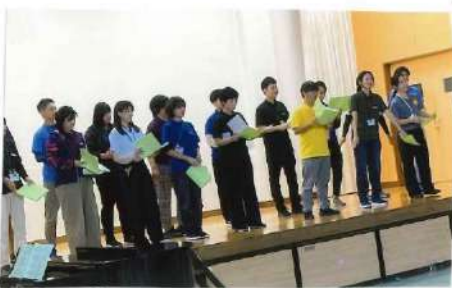
長坂小学校 先生方の合唱 （わいわいまつり会場）

16歳から参加できます（親子スポーツ、小学生バスケットを除く） 初回 無料体験実施中