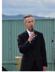
▶泉佐野市議会 新田輝彦議長