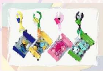
キャンディバッグキーホルダー