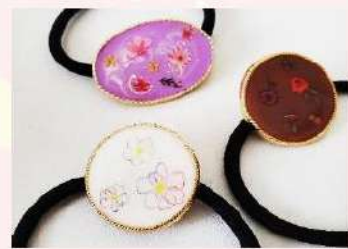
レジンアクセサリ