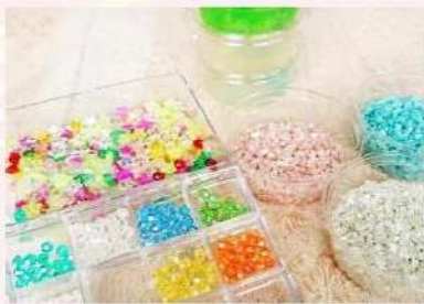
スライム&フォトフレーム