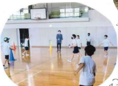
ドッジボール(体育館にて)