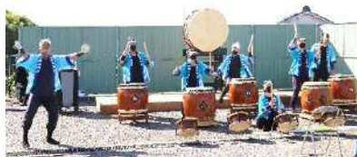
▲太鼓集団「潮」・青少年分館太鼓クラブ