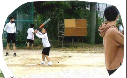
大学生のお兄ちゃんと野球!