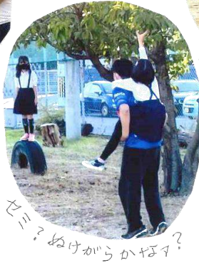
セミ?ぬけからかぼす?