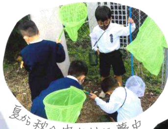
夏から秋へ虫とりに夢中