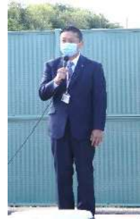
泉佐野市 千代松大耕市長