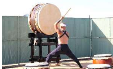
▲オープニング 太鼓集団「潮」