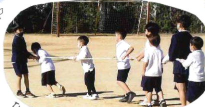
「だんじり」つなひぎごっこ♪