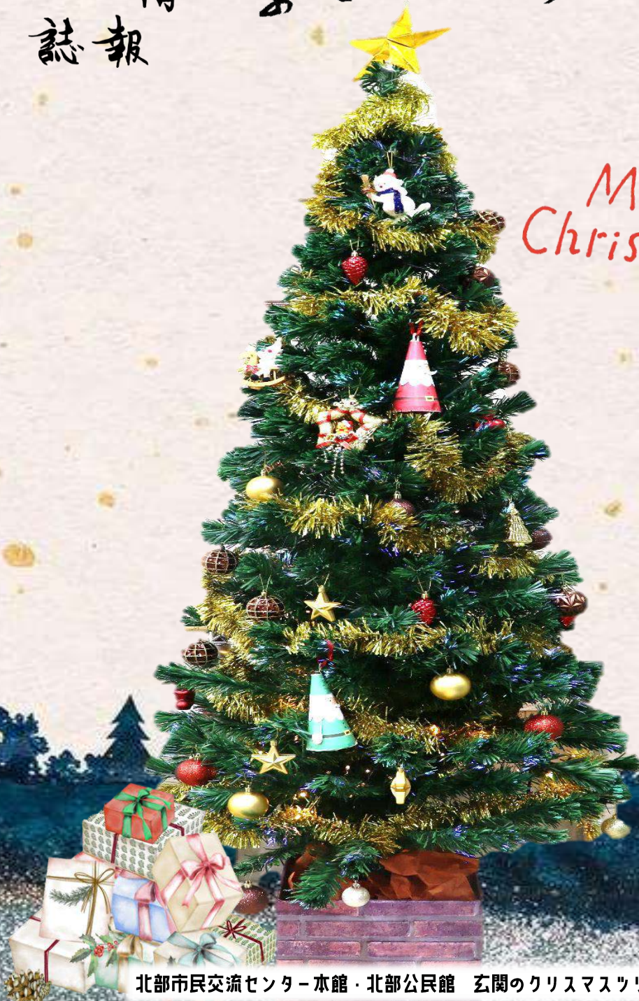
北部市民交流センター本館・北部公民館 玄関のクリスマスツリー