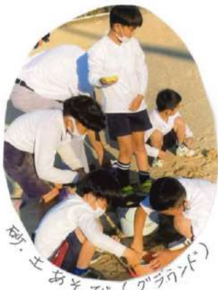
砂・土あそび(グラウンド)

青少年分館では、長引くコロナ禍の中で「少人数の分散型活動」をめざして、いろいろな活動メニューを計画しています。その取り組みの一部を写真でご紹介します。