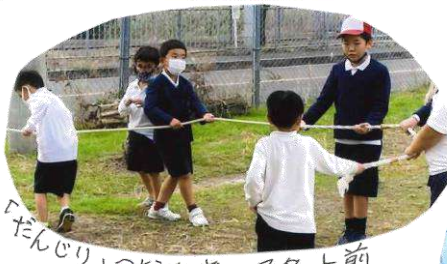
「だんじり」つなひぎのスタート前