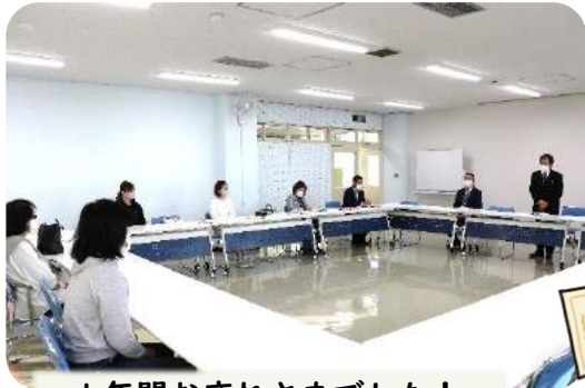
1年間お疲れさまでした！

修了式に参加できなかった生徒には、後日賞状が手渡されました。1年間の学び中で培ってきたことを、今後も存分に活かせるように願っています。