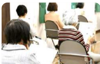
歌詞を見ながらハミング♪