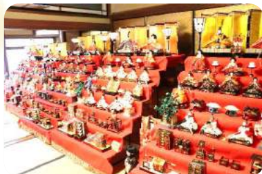
✿ たくさんのおひな様が飾られていて、圧巻です。