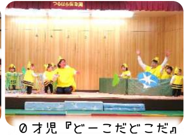
0才児『どーこだどこだ』