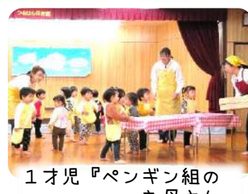
1才児『ペンギン組のお母さん』