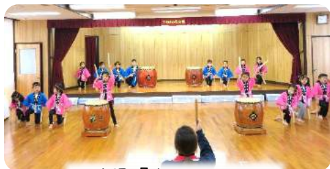
5才児『まつりだいこ』

観客がない中での開催でしたが、園児たちは劇や太鼓、うた、ダンスなど、素敵な笑顔でがんばっていました。