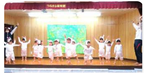
2才児『かくれんぼうさぎ』