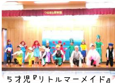
5才児『リトルマーメイド』