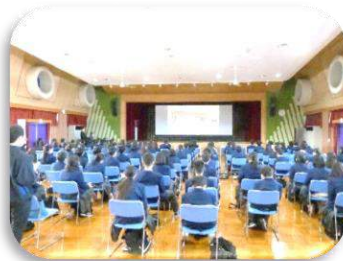
映像による地域理解