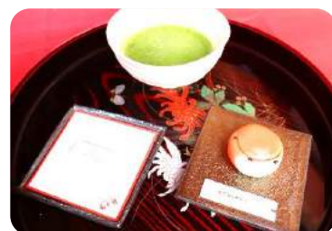
✿ 庭でいただく練り菓子とお抹茶セット 練り菓子は季節ごとに変更されます。 ひな祭りの時期は「五人囃子の太鼓」を イメージした練り菓子でした。