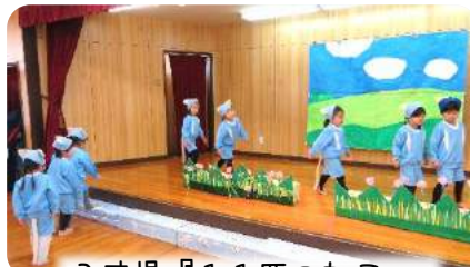
3才児『11匹のねこ ふくろの中』