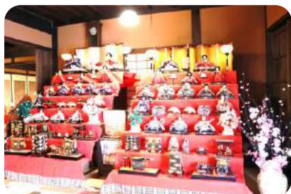
✿ 入り口を入ると早速おひな様がお出迎え