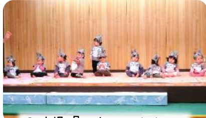
0才児『ひよこのトトロ』

2月10日(水)、鶴原保育園にて発表会が行われました。 今年は新型コロナウイルスの感染拡大防止の為、予行練習も本番も観客を入れずに行い、後日DVDに収録し配布されることになりました。