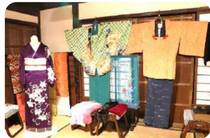
← ✿ 町屋館に保管されていた着物の展示コーナー 他にも嫁入り衣装や帯の展示もありました。