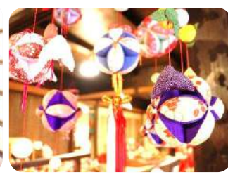
✿ ふるさと町屋館手芸クラブの手作り吊るし飾り