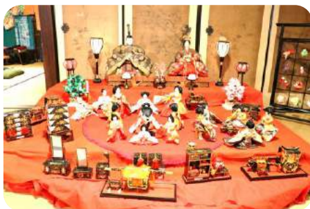
✿ 江戸時代のおひな様、保存状態もキレイで 神々しさも感じられました。