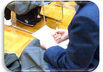
真剣にメモを取る