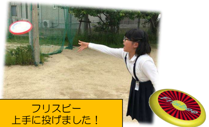
フリスビー 上手に投げました！

空き缶・古新聞回収（回収地域は、鶴原東町） 今月は、6月9日（土）午前10時～（雨天中止 ☔）