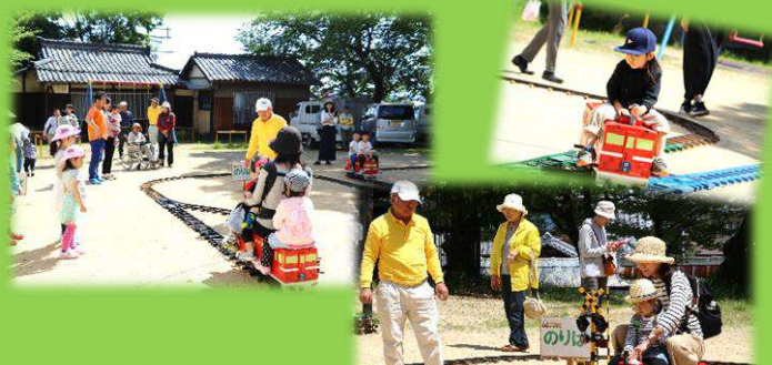
中庄福祉委員のみなさん