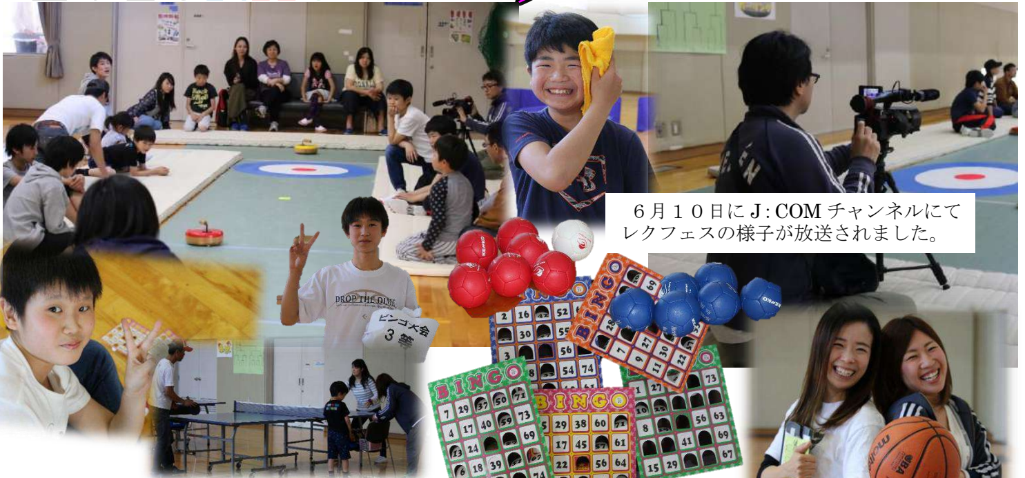
6月10日にJ:COMチャンネルにてレクフェスの様子が放送されました。

たくさんのご参加ありがとうございました。 来年はさらに楽しめるようにスタッフ一同頑張ります。