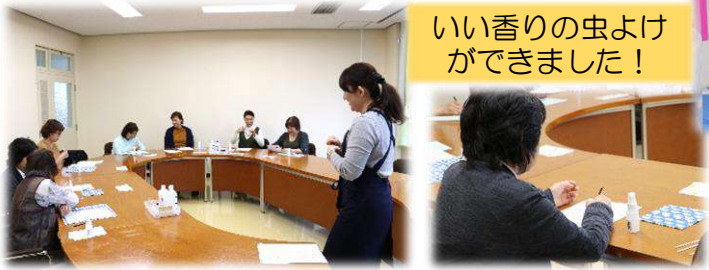
いい香りの虫よけができました！