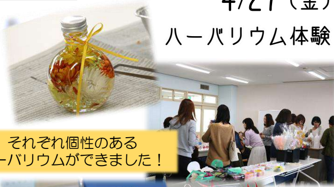
それぞれ個性のあるハーバリウムができました！