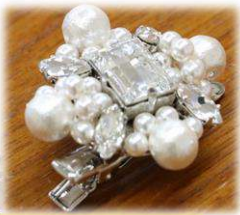
キラキラで華やか