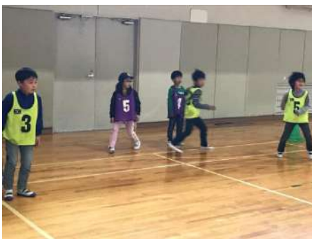
白熱のドッチボール大会!

今年の春休みは天候がよく、屋外で元気よく遊ぶ子どもたちの姿がとても印象的でした。おやつづくりやスポーツ活動では、仲間たちと協力して、楽しくとりくみました。