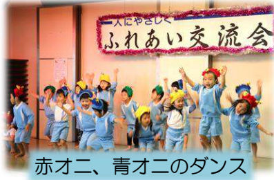
赤オニ、青オニのダンス