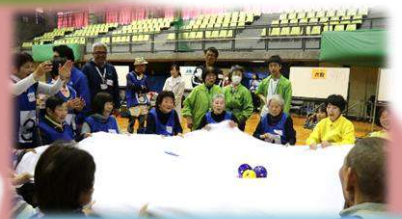
チームみんなで息を合わせて