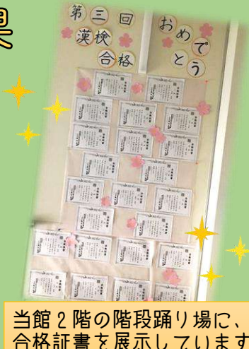
当館2階の階段踊り場に、合格証書を展示しています