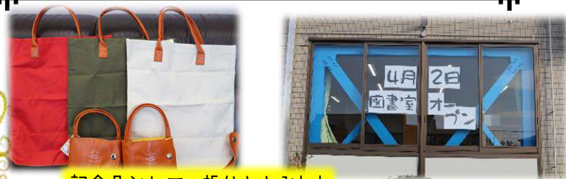
記念品として、折りたためたトットバッグを先着順配布しました。