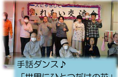
手話ダンス♪ 「世界にひとつだけの花」