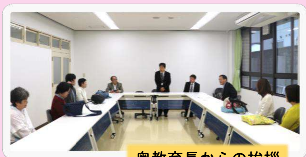
奥教育長からの挨拶