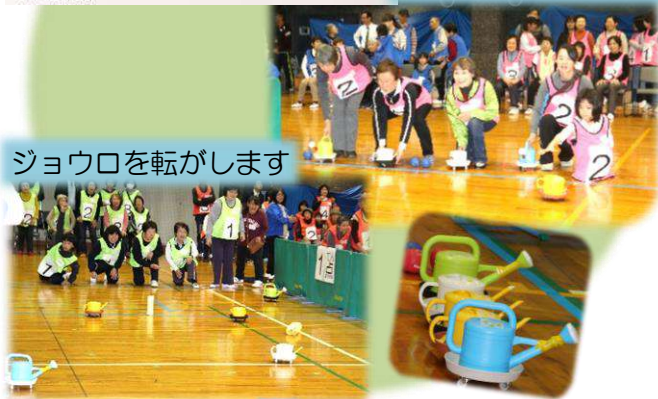
ジョウロを転がします