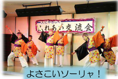
よさこいソーリャ!