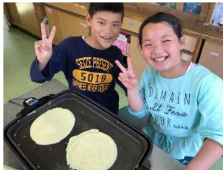
上手に焼けました~★