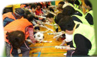
ディフェンス・オフェンスの熱い攻防

チームで一列の椅子に座る。中央から各グループのゴールに向かってボールを棒で転がす。ボールがチームのゴールに入ったチームに得点が入る。得点の合計を競う。