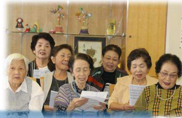
アコーディオンの演奏