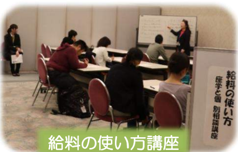
給料の使い方講座

参加されたみなさんは「就職」への第一歩をふみだし、これから臨む就職活動に思いをひきしめていました。