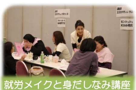
就労メイクと身だしなみ講座