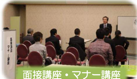
面接講座・マナー講座