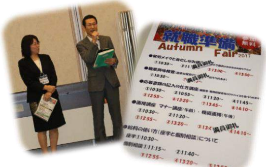
応募書類の記入の仕方講座