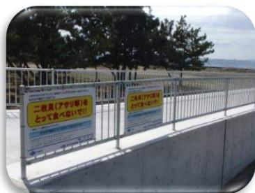
(アサリの採取と貝毒検査)